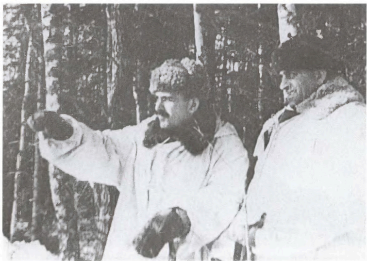
Рекогносцировка местности советскими командирами. Район Угры. Зима 1941/42 г.