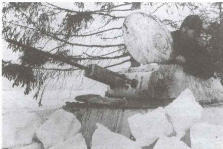
Замаскированный советский танк Т-60. Район Угры. Зима 1941/42 г.