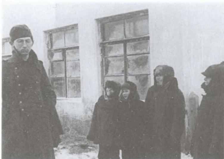
Немецкий солдат, плененный во время наступления 49-й армии. Этот уже отвоевался, и мальчишки его не боятся