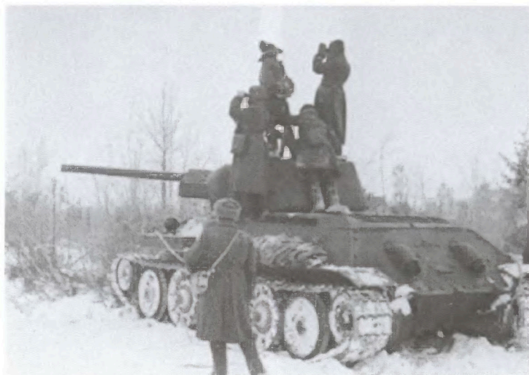
Наблюдение за противником. Район Высокиничей. 1941 г.