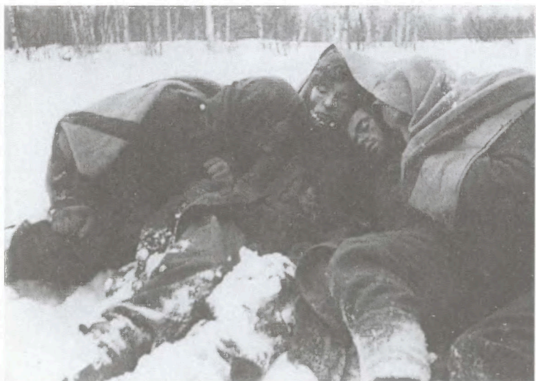
Пленные немецкие солдаты пытаются согреться под почтовыми мешками. Подмосковье. Декабрь 1941 г.