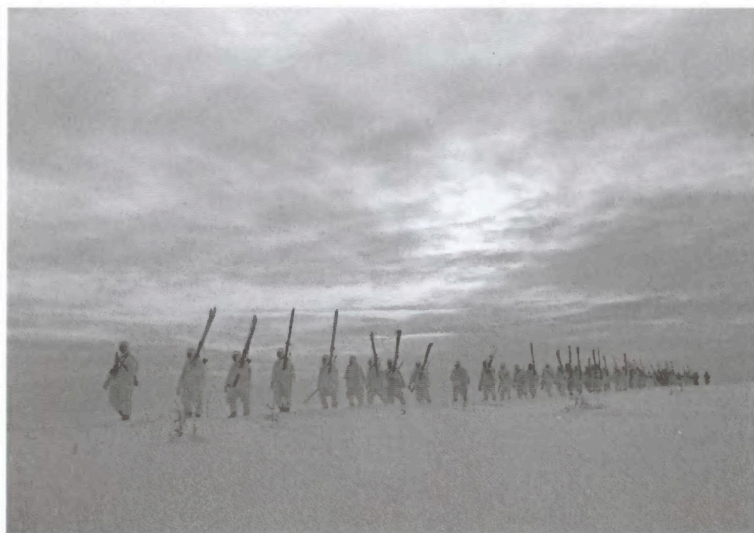
Лыжный батальон выдвигается к рубежу атаки. Район Угры. Зима 1941/42 г.