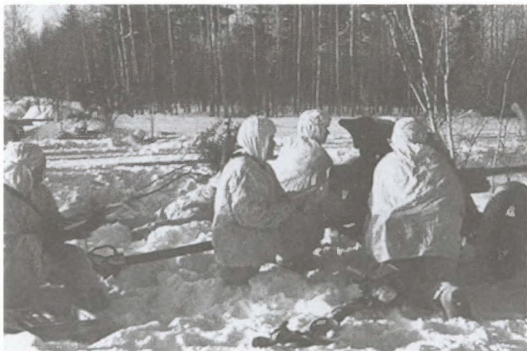
Расчет 45-мм противотанкового орудия на позиции. 49-я армия. Декабрь 1941 г.