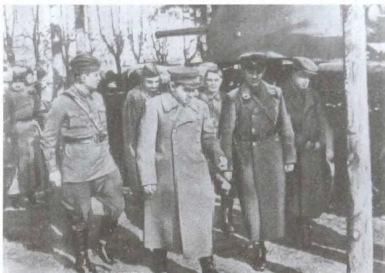
Командир 112-й танковой дивизии А.Л. Гетман в расположении дивизии под Серпуховом