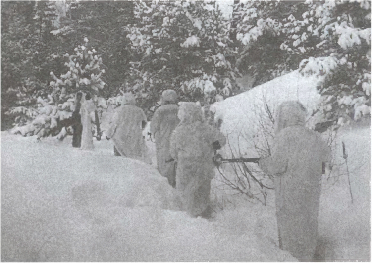
Моряки 4-го дивизиона гвардейских минометов в разведке юго-западнее Серпухова