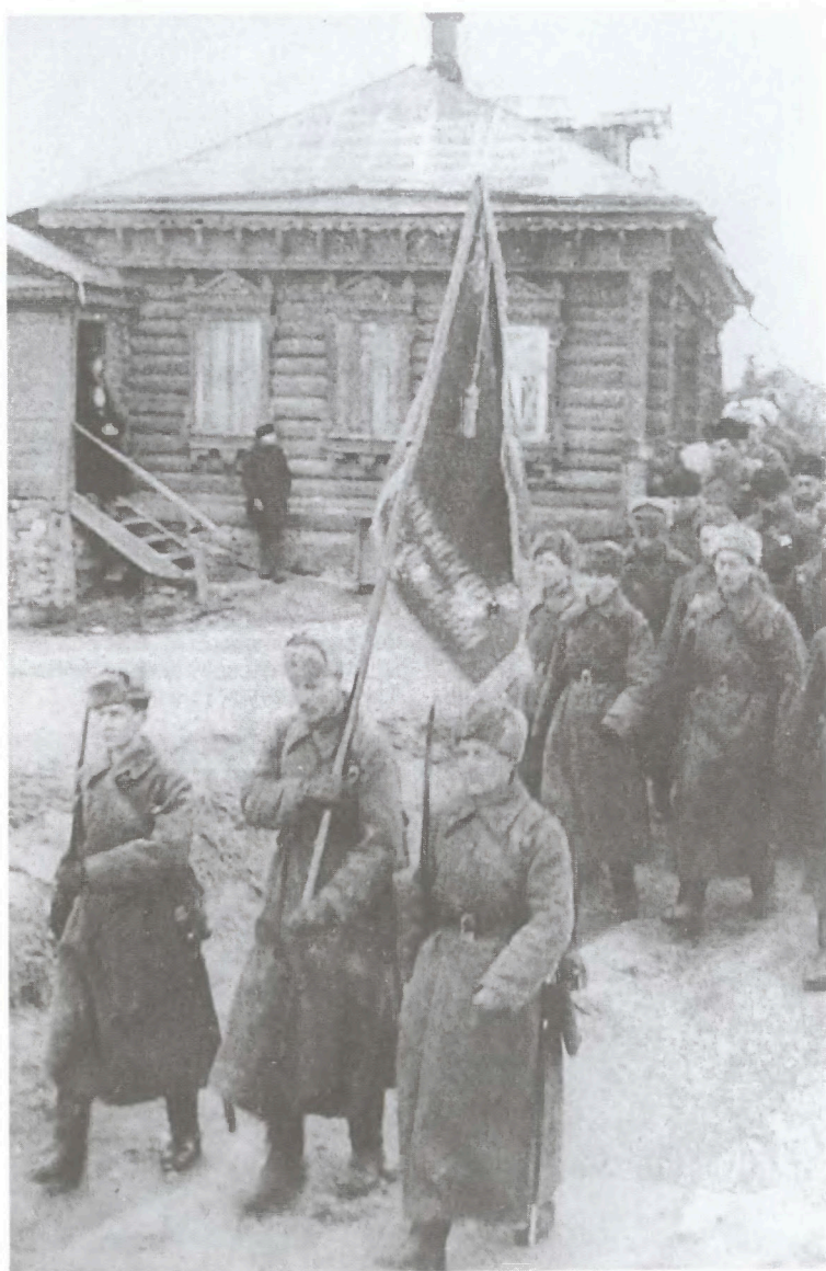
Бойцы 49-й армии входят в освобожденный районный центр Московской области Высокиничи