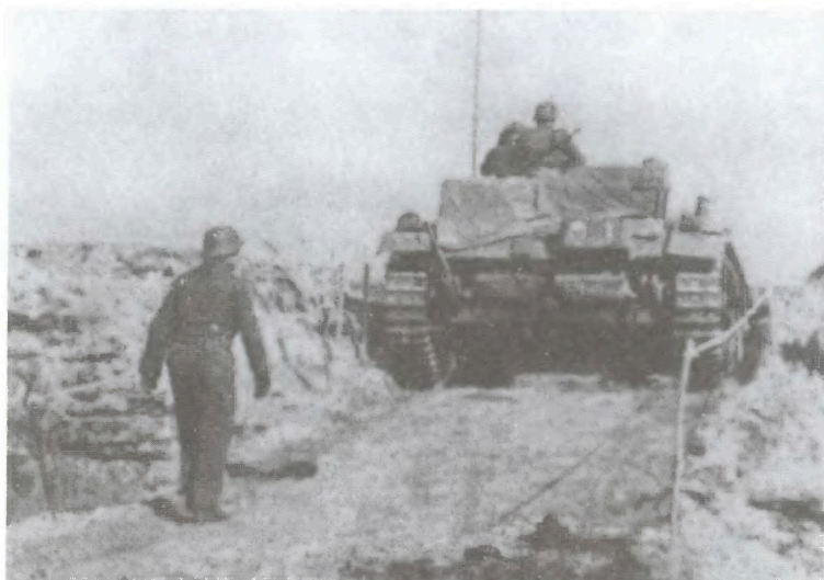
192-й немецкий батальон штурмовых орудий под Серпуховом