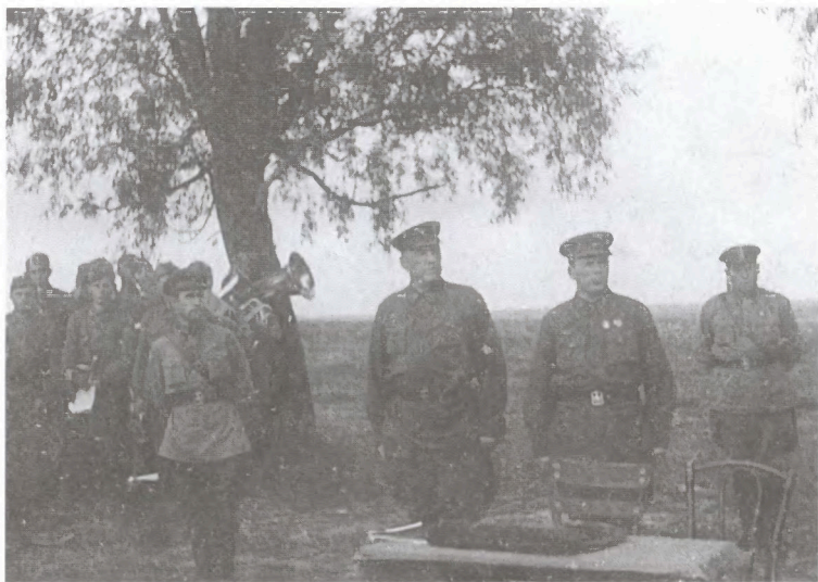
Вручение наград в одной из стрелковых дивизий. На Угре. Весна 1942 г.