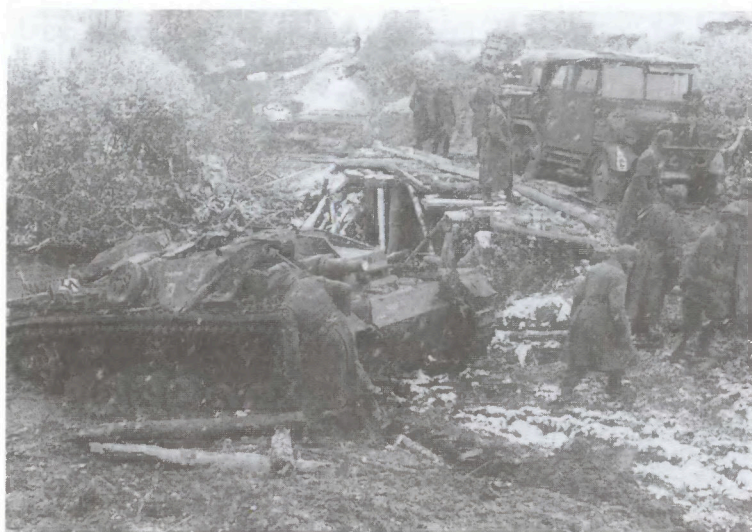
Так они подходили к Серпухову и Алексину. Конец октября 1941 г.