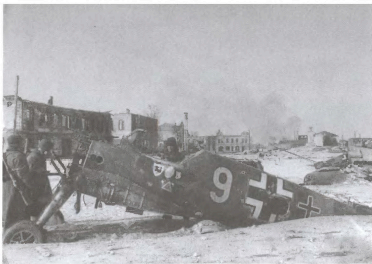
Советские солдаты у разбитого истребителя Вф.109 в освобожденном Юхнове