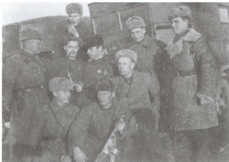
Разведгруппа 5-й гвардейской стрелковой дивизии. Весна 1942 г. Район Угры