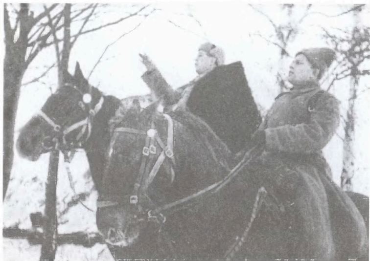
Командиры полков 1-го гвардейского кавалерийского корпуса на рекогносцировке