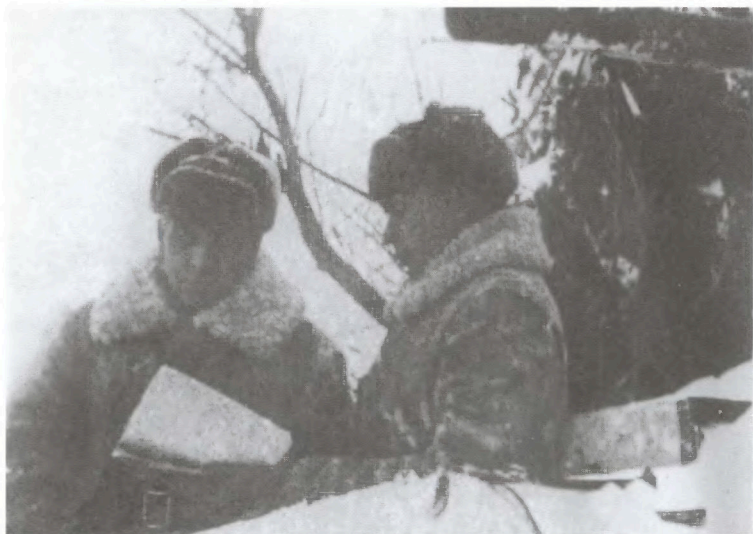
Командир танковой бригады 49-й армии ставит боевую задачу перед наступлением