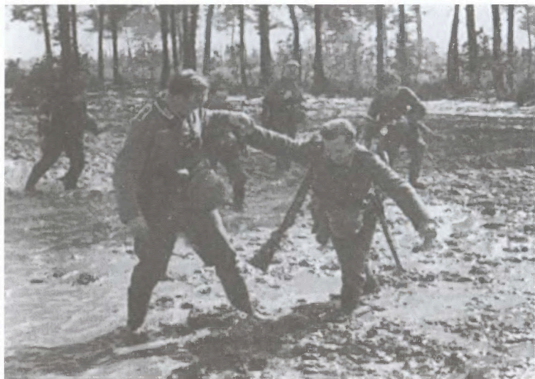
Русское бездорожье. Грязь еще кажется экзотикой... Октябрь 1941 г.