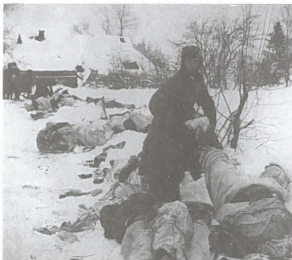
Солдаты 268-й немецкой пехотной дивизии снимают валенки с убитых советских лыжников