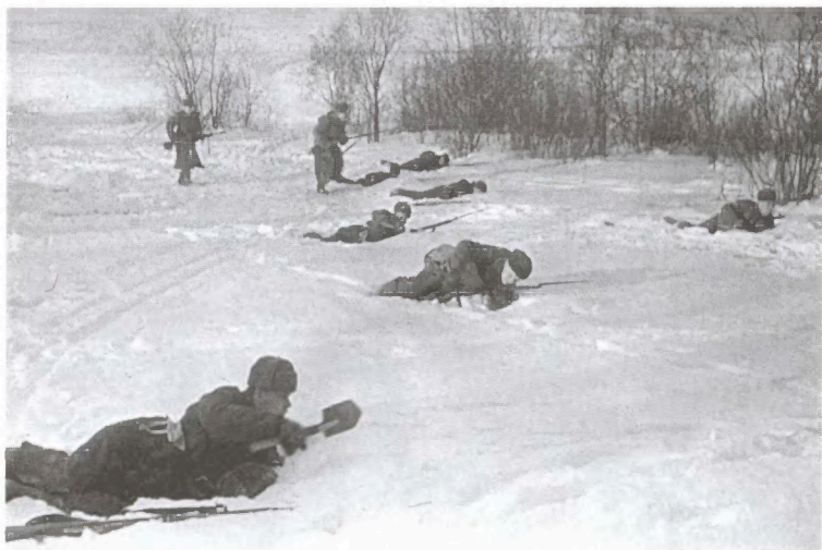
Атака советского подразделения. Район Юхнова. Зима 1941/42 г.