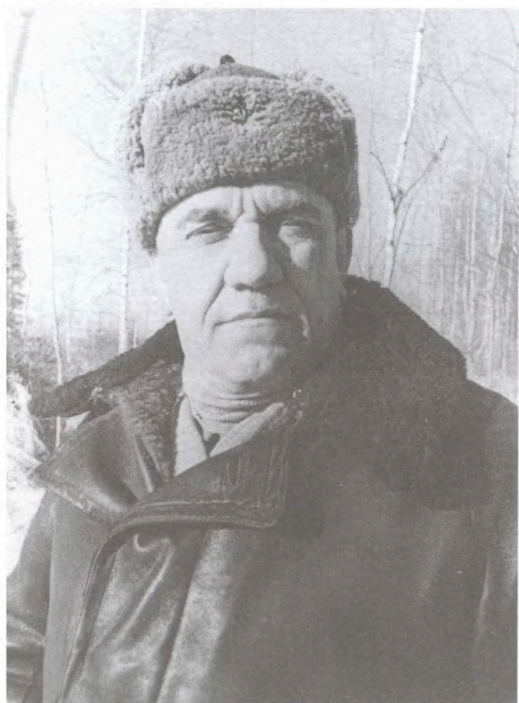
Генерал И.Г. Захаркин