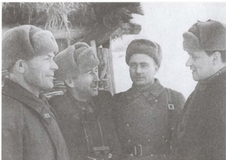
Командование 1-го гвардейского кавалерийского корпуса. Второй слева — генерал Павел Алексеевич Белов