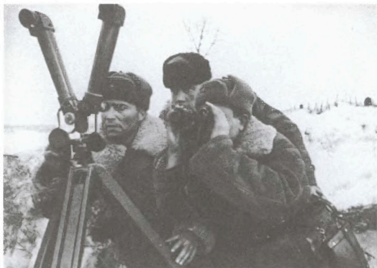
А.В. Чапаев на своем НП. Район Угры. 1942 г.