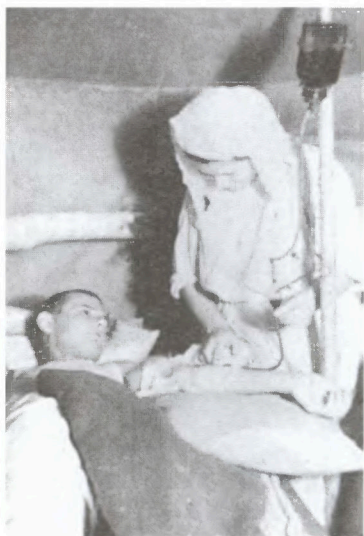
Полевой госпиталь 5-й гвардейской стрелковой дивизии. Район Серпухова