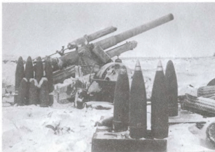
Брошенная немецкая артиллерийская позиция. Район Тарусы. 1941 г.