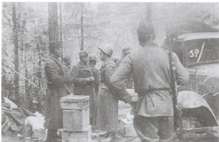
В 5-ю гвардейскую стрелковую дивизию из Сибири пришли посылки. Район Юхнова. Весна 1942 г.