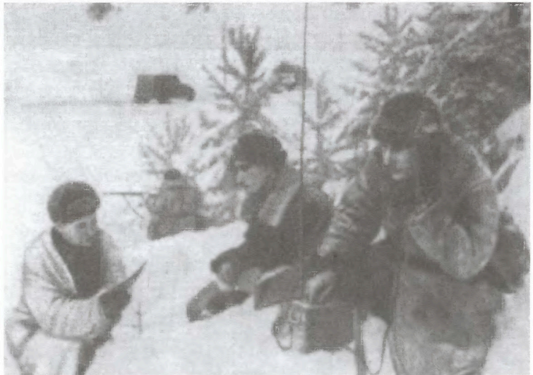
Корректировщики 4-го морского дивизиона гвардейских минометов