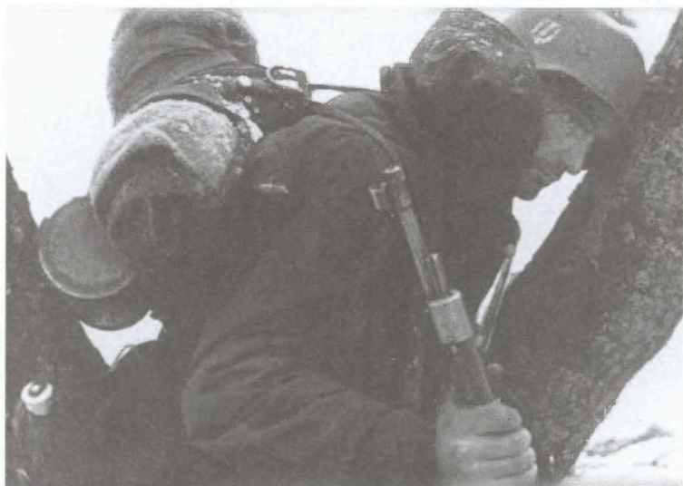
«Господи, куда меня занесло!» Подмосковье. Декабрь 1941 г.