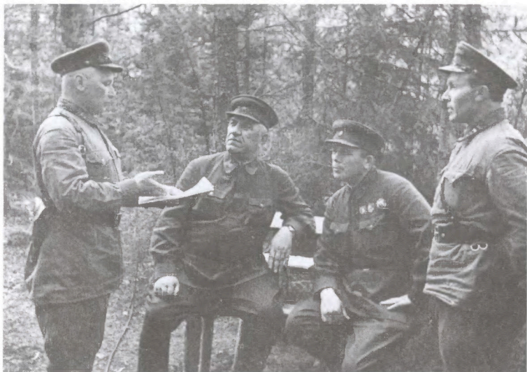
Генерал И.Г. Захаркин с офицерами штаба. Район Юхнова. Весна 1942 г.