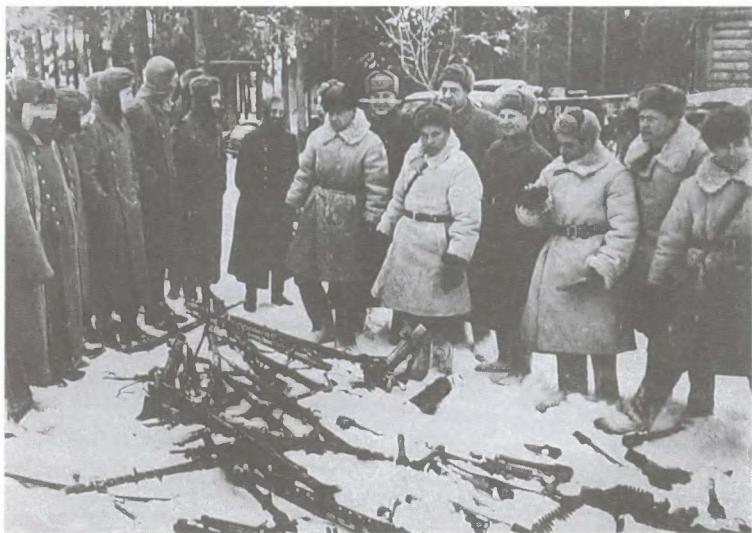
Декабрь 1941 г. Остатки разбитой немецкой части сдают стрелковое оружие командирам 49-й армии