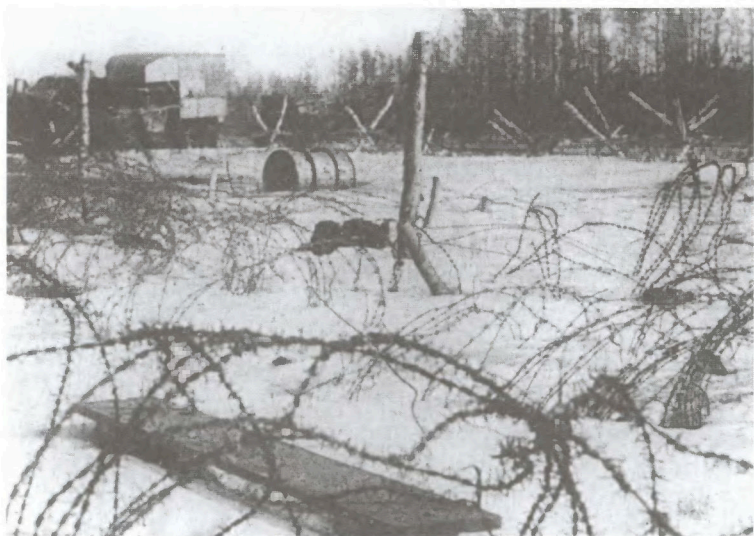
Немецкие укрепления северо-западнее Серпухова. Декабрь 1941 г.