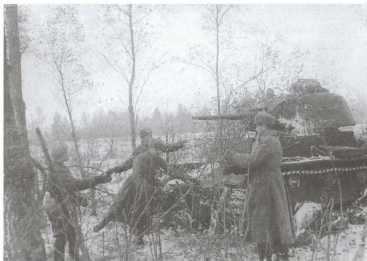
Маскировка легкого танка Т-26. Район Серпухова. 1941 г.