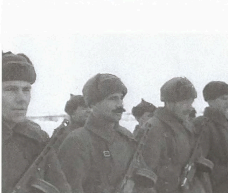
Вручение знамени одному из подразделений 1-го гвардейского кавалерийского корпуса